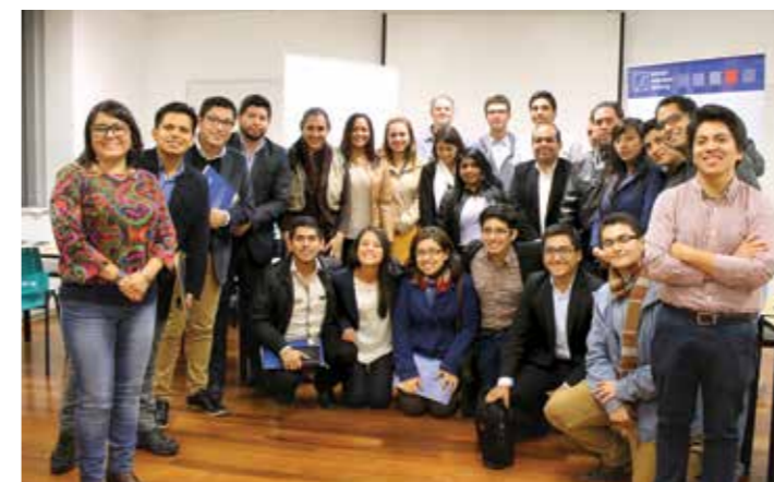
Democracia y Participación política: La política en acción nuevas dinámicas entre las juventudes peruanas y los partidos políticos

Este informe en derecho brindó insumos jurídicos destinados a la construcción de una jurisprudencia sólida y protectora con respecto al delito de trata de personas y a las formas contemporáneas de esclavitud, en particular al trabajo forzoso y a la servidumbre por deudas.