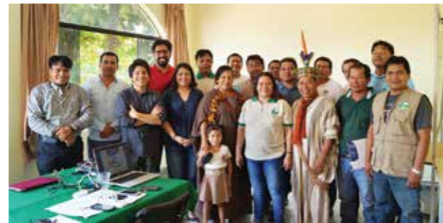
Taller en el marco del Proyecto «Gobernanza intercultural construyendo ciudadanía desde el fortalecimiento de capacidades y la incidencia en líderes indígenas amazónicos».

la elaboración de un diagnóstico participativo con organizaciones indígenas amazónicas en las regiones de San Martín y Ucayali; la implementación de la Diplomatura de Estudios de Gobernanza Indígena Amazónica en ambas regiones del país; y el otorgamiento de becas para la Maestría en Derechos Humanos. Durante el 2016 se avanzó en el primer componente del proyecto.