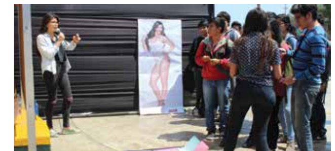
Intervención pública en la Universidad Nacional Mayor de San Marcos.