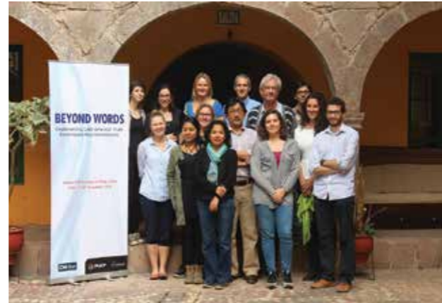
Taller "Beyond Words" organizado por el IDEHPUCP y el CHR, Michelsen Institute, Pisac.

Asimismo, el IDEHPUCP inició las actividades del proyecto «Gobernanza intercultural: construyendo ciudadanía desde el fortalecimiento de capacidades y la incidencia en líderes indígenas amazónicos» (2016-2017) , el cual se ejecuta con la colaboración de MISEREOR. Comprende tres componentes: