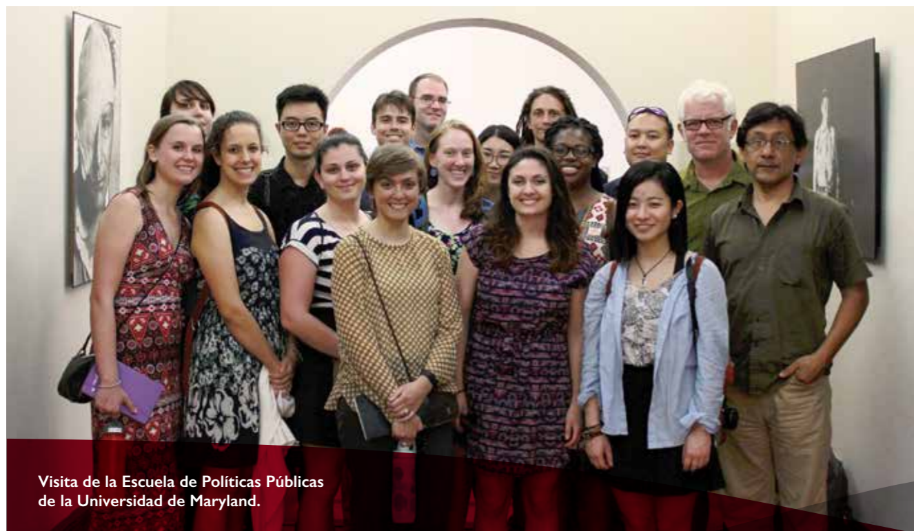
Visita de la Escuela de Políticas Públicas de la Universidad de Maryland.