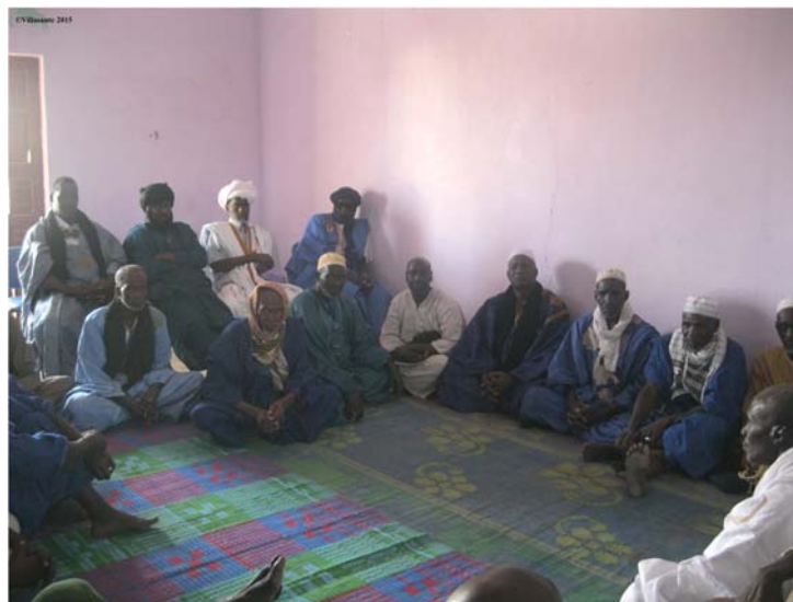
Reunión del Colectivo de víctimas de la represión militar (COVIRE), Nouakchott

• Las asociaciones de víctimas y las ONGs que defienden los derechos humanos tienen un árduo trabajo, facilitado por el apoyo constante de los organismos internacionales, los cuales podrían tener también un rol más activo en la transferencia de conocimientos del derecho humanitario internacional, muy poco conocido en el Perú y más aún en Mauritania.