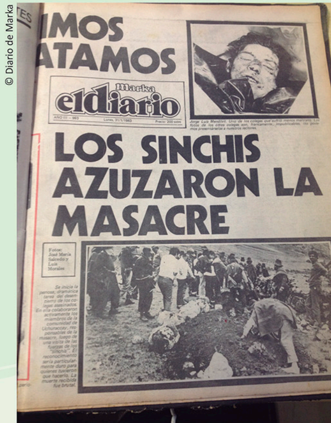
Portada del El diario Marka 31 de enero de 1983.

La portada del lunes 31 de enero de 1983 difiere bastante de aquella de la que, en un principio, Marka informa sobre este hecho a la sociedad y sobre todo a sus lectores. En esta segunda portada, la carga referencial e informativa recae en la imagen que aparece en portada.