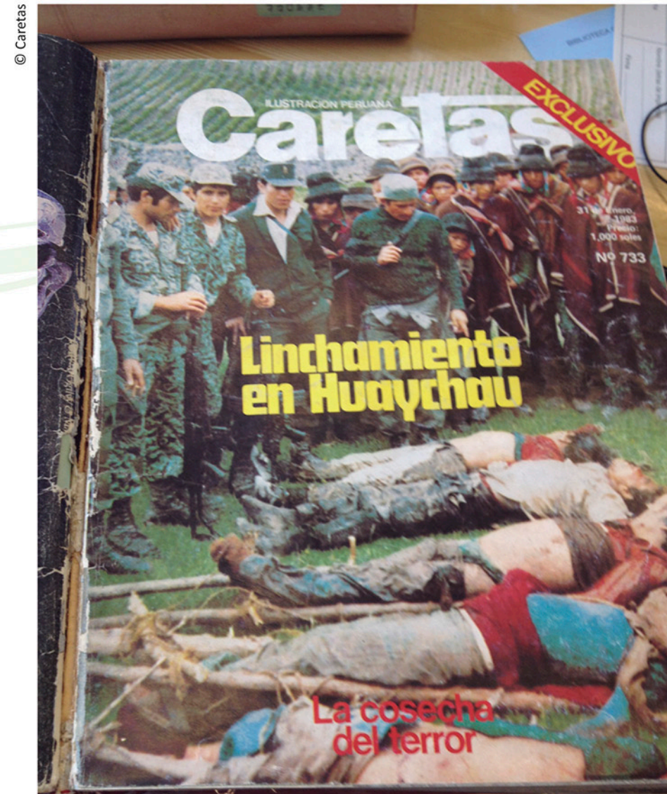
Portada de Caretas del 31 de Enero de 1983.

“En ese sentido, las fotografías periodísticas brindan un importante mecanismo de recuerdo y construcción de memoria, ya que mediante el lenguaje visual de sus imágenes describen y narran hechos, momentos y sucesos dados por la misma naturaleza informativa de las fotos”