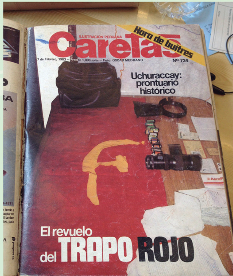
Portada Caretas del 7 de Febrero de 1983.

La segunda portada que se analiza es del 7 de febrero de 1983. Se especuló que los comuneros habían confundido a los periodistas con terroristas por un trapo rojo que llevaban. Posteriormente, por medio de investigaciones, se supo que los periodistas quisieron sacar un trapo blanco que simbolizaba la paz para intentar calmar los ánimos de los pobladores y detener el trágico desenlace que tuvo este episodio.