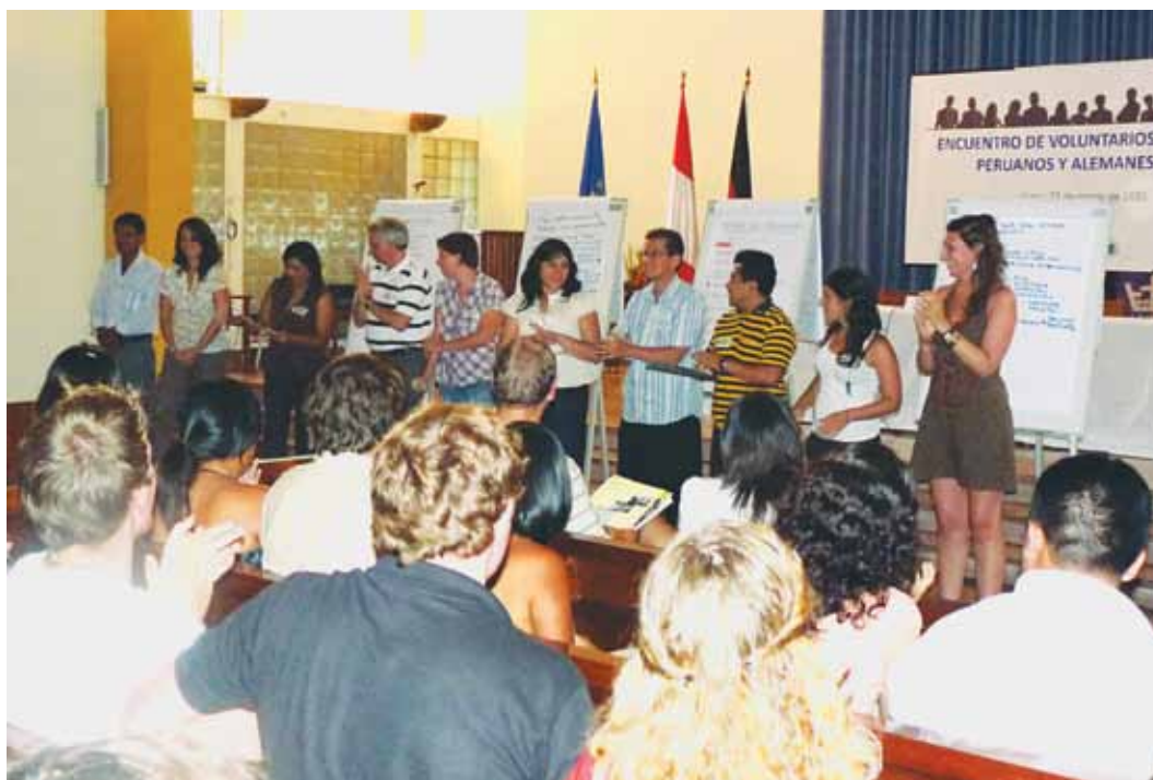
II Encuentro de voluntarios peruanos y alemanes.