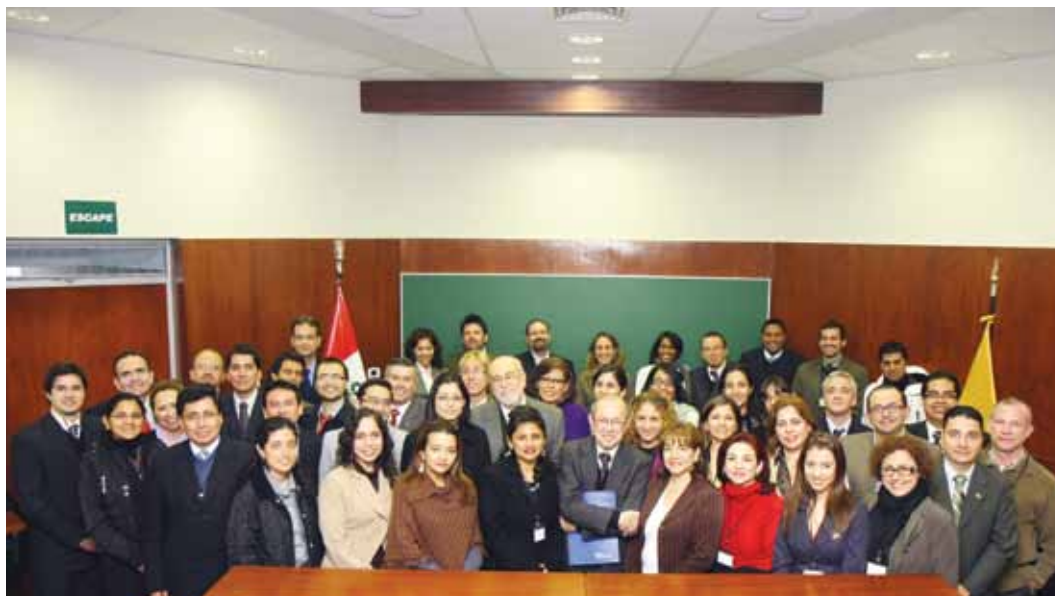
Participantes del Diploma de Post Título Derechos Humanos y Juicio Justo 2010.

Esta red de formación es una iniciativa interuniversitaria destinada a apoyar la capacitación de jueces, fiscales y defensores públicos en el uso de los estándares interamericanos de derechos humanos. La red cuenta con el auspicio de la Comisión y la Corte Interamericana de Derechos Humanos y con la colaboración de la Oficina Regional del Alto Comisionado de Naciones Unidas y el Instituto Interamericano de Derechos Humanos.