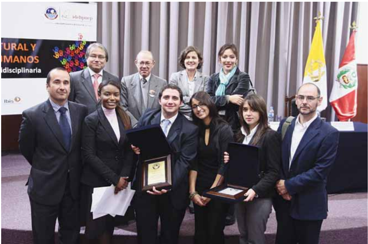
Ganadores del IV Concurso de Derechos Humanos.