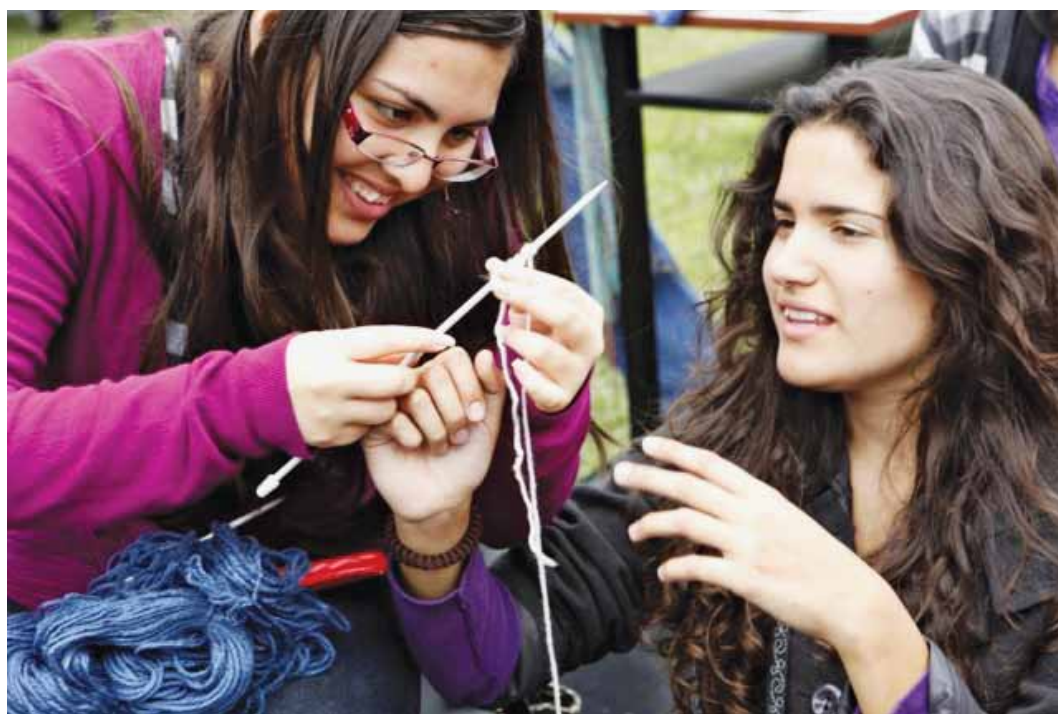
Jóvenes participando en el tejido de la "Chalina de la esperanza".

De esta forma, se organizó la feria de organizaciones gubernamentales y de la sociedad civil, nacionales e internacionales, que expusieron sus experiencias sobre interculturalidad y derechos humanos en campos como la salud, la educación, la justicia y el desarrollo. Se contó con la presencia de veintisiete organizaciones.