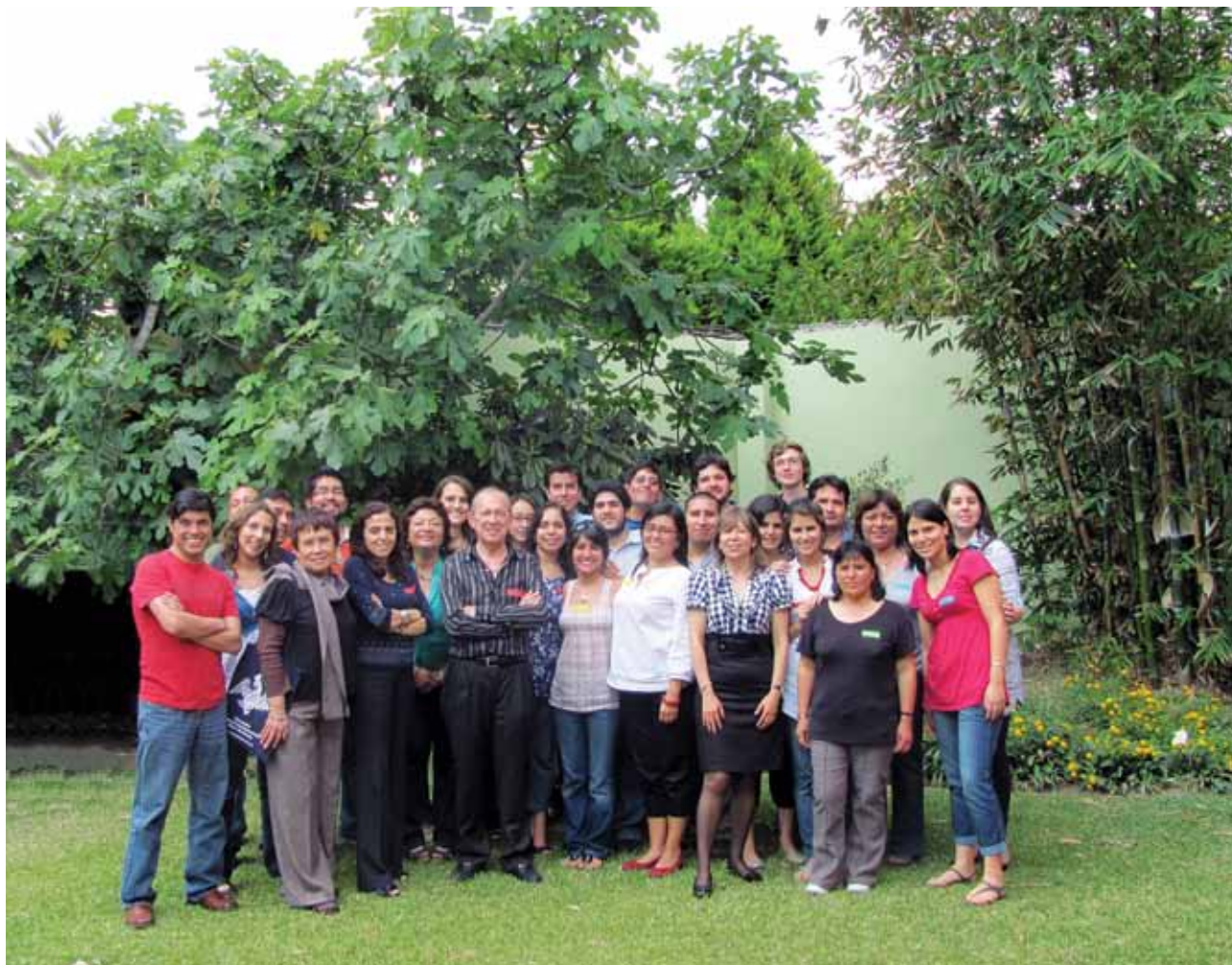
Directivos y personal del Idehpucp.