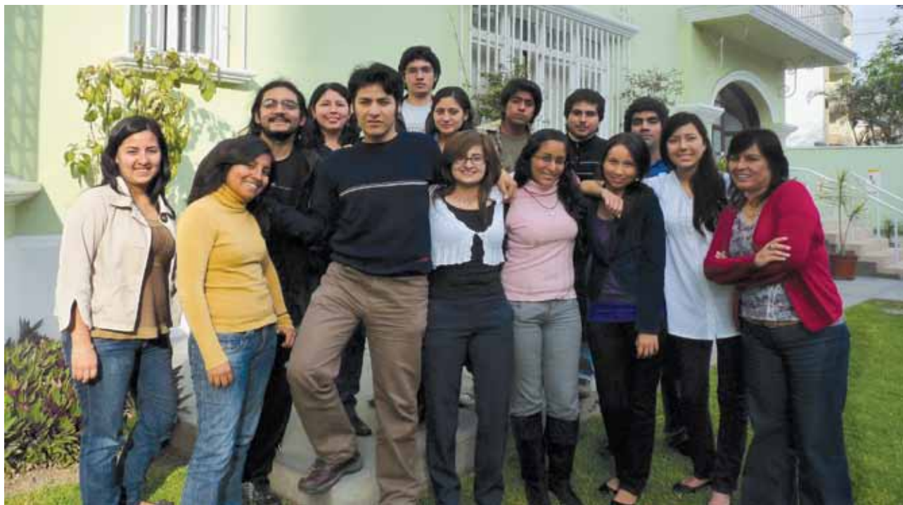
Clausura del Programa de Voluntariado 2010.

Yuyanapaq, al igual que sesiones de diseño y planificación de actividades de incidencia pública que se realizaron en el VI Encuentro de Derechos Humanos.