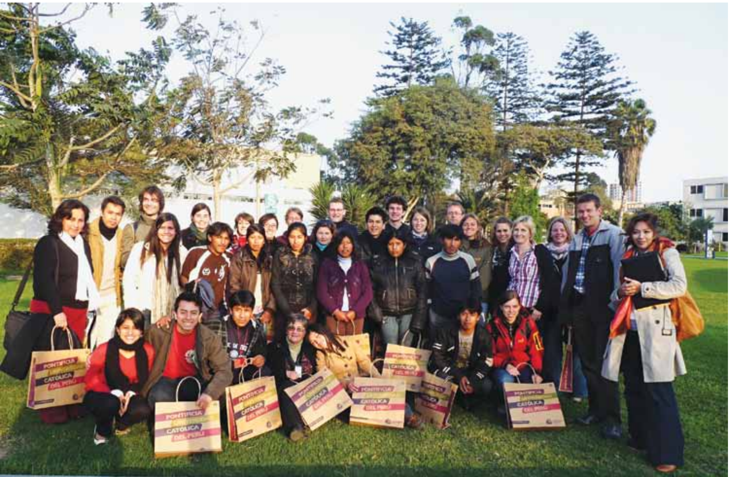
Jóvenes de la comunidad católica universitaria de Karlsruhe, Alemania y del grupo pastoral "Kushkalla Purisun" de la prelatura de Sicuani, Cusco.