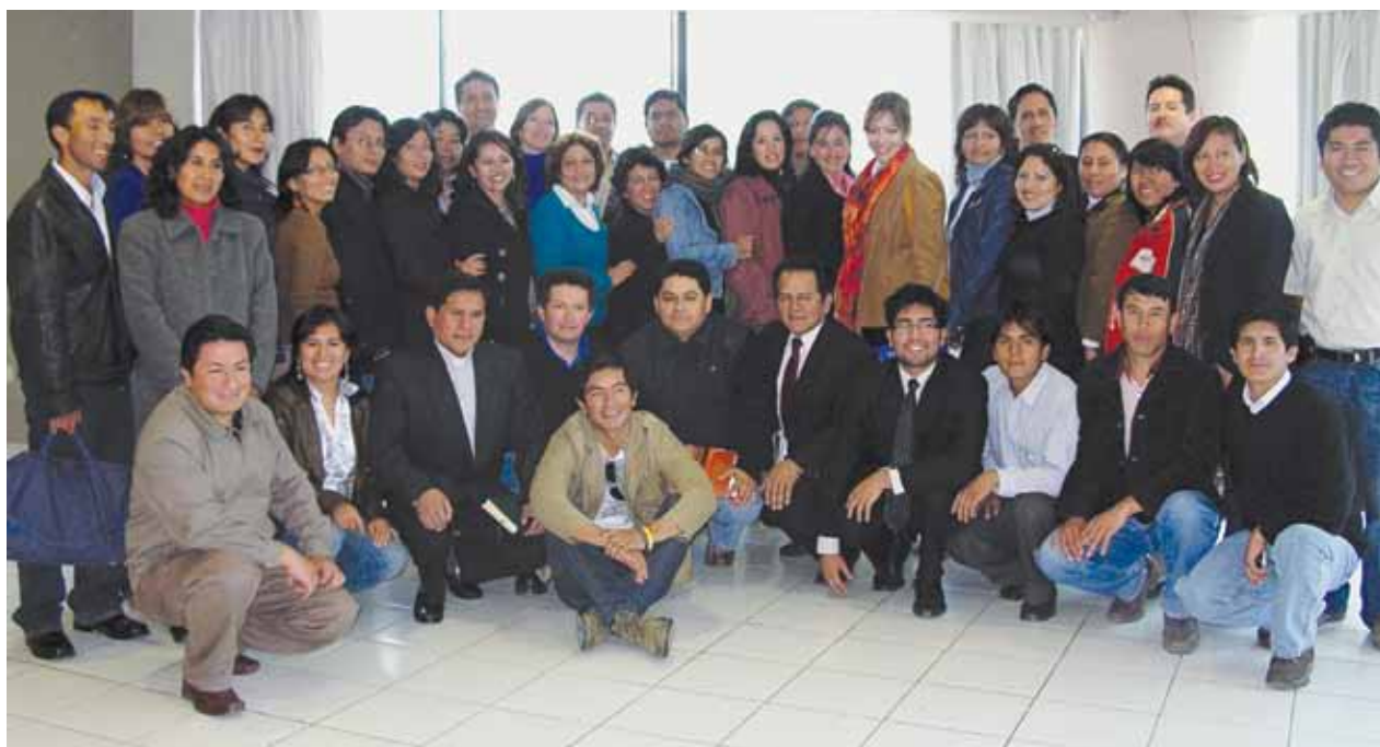
Alumnos del Diplomado Descentralizado en Ancash.

El diploma Derechos Humanos y Juicio Justo se enmarca en un proyecto de capacitación de la Red Interamericana de Formación en Gobernabilidad y Derechos Humanos (RIFDH), el Colegio de las Américas de Canadá (COLAM) y la Organización Universitaria Interamericana (OUI).