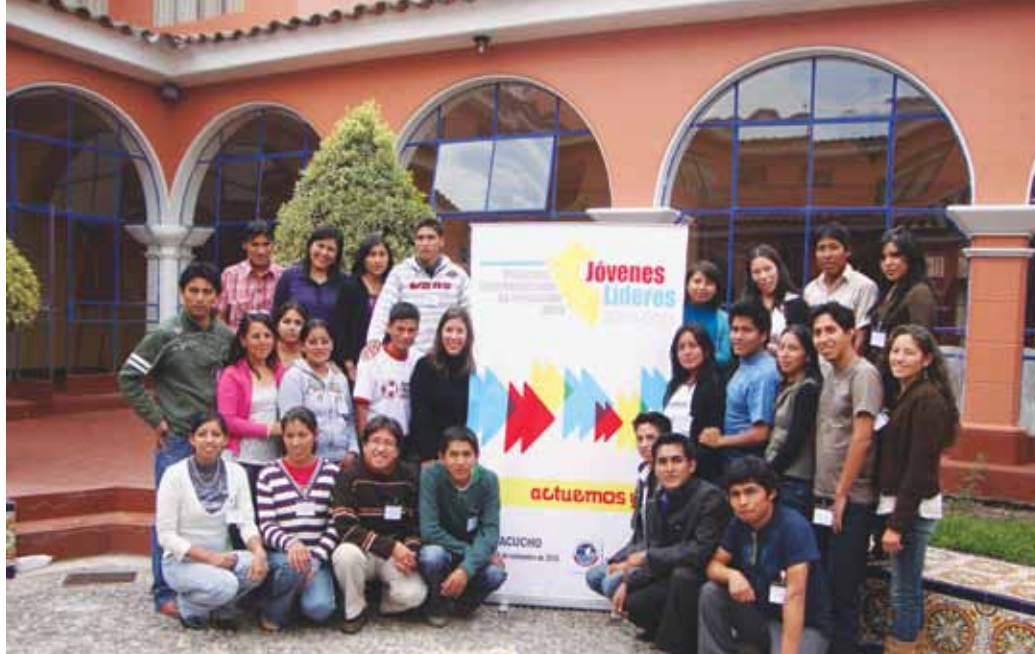
Participantes del Programa de Jóvenes Líderes - Ayacucho

Cada edición tiene una duración de cinco días.